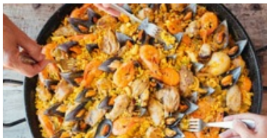
TOP 10 nejchutnějších jídel evropské kuchyně

Zavazadlo umístíme do prostor, které se nacházejí nad sedadly a slouží tomuto účelu.