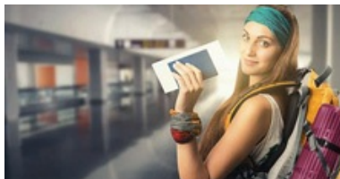
Jak sbalit příruční zavazadlo do letadla?